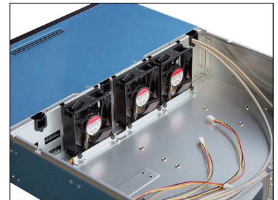
Three 80mm x 25mm Sunon 2ball bearing fans