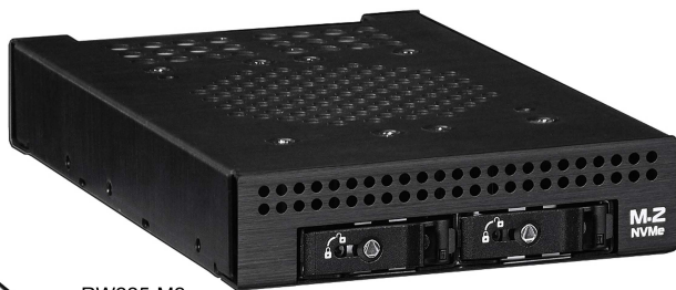
RW225-M2 1x3.5" FDD to 2 x M.2 SSD Removable Cage M.2 NVMe 64G